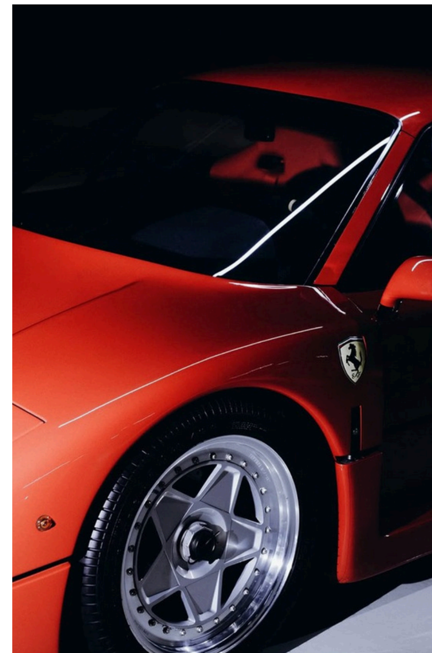
THE COLLECTION PARIS Olfactive signatue