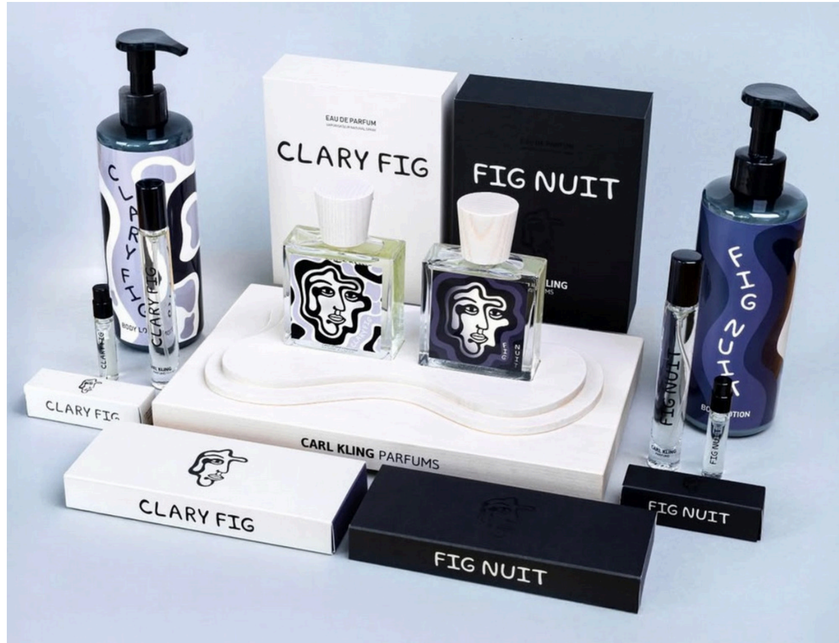
Carl Kling Body Lotions